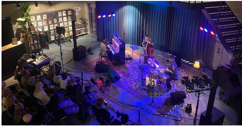
Bild tagen vid Tranemo Jazzfestival